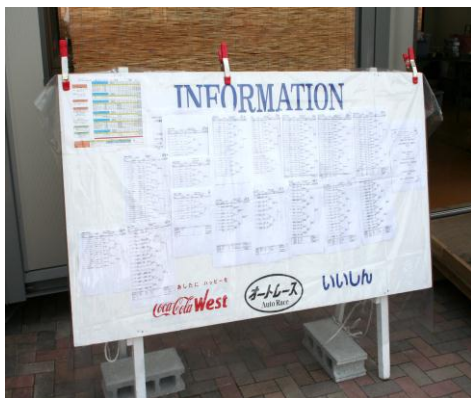
インフォメーションボード 大会本部前