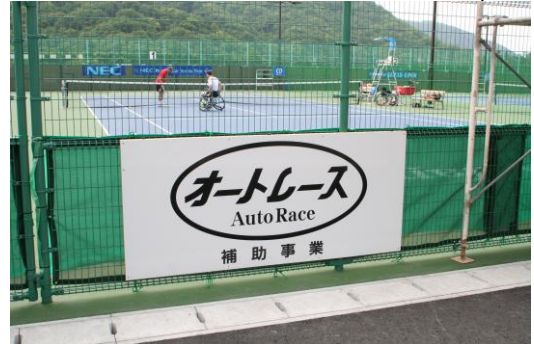
テニスコートサイド看板